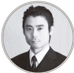
リアルマッスル泉 コーラス、パフォーマンス